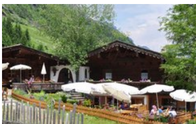
Laponesalm - Gschnitztal

Empfehlungen: Unterkunft u. Einkehr, Essen & Trinken, Shoppen & Erleben