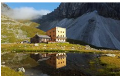
Tribulaunhütte - Pflerschtal, 2369 m