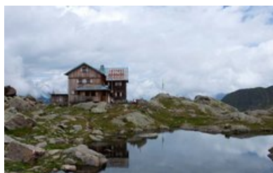
Bremer Hütte, 2413 m - Gschnitztal