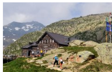
Magdeburger Hütte, 2423 m - Pflerschtal