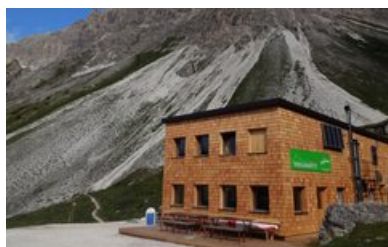
Tribulaunhütte - Gschnitz, 2064 m