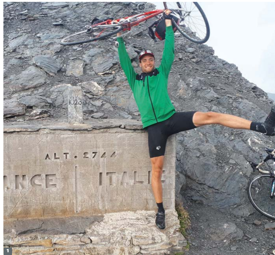
Seite 74 Abfahrt am Col de l'Iséran