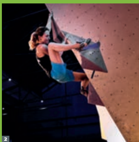
1 2016 erfolgreicher denn je: die Nachwuchskletterer von „München & Oberland“

Das Kletterteam München & Oberland bewies im Laufe des Jahres 2016, dass es im bundesweiten Vergleich absolut erstklassig ist. Rund 350 Kinder und Jugendliche aus München trainierten regelmäßig in den Klettertrainings unseres Fördersystems. Weitere 80 Kinder und Jugendliche