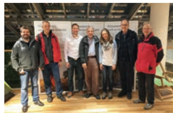
Der Sektionsvorstand war beeindruckt vom Informationsgehalt der Ausstellung

Im Februar hatte das Mitarbeiterteam der Sektion Oberland die DAV-Ausstellung „Klimawandel – Klimaschutz“ nach München geholt und präsentierte die sehr informative Schau vor der Alpenvereins-Servicestelle im 2. Stock der Globetrotter-Filiale am Isartorplatz. Der Sektionsvorstand ging mit gutem Beispiel voran und war beeindruckt vom Informationsgehalt der Tafeln und der interaktiven Station. Wer die Ausstellung verpasst hat, kann sich die digitale Version im Internet unter alpenverein.de/Natur-Umwelt/Klimaschutz/Ausstellung-Klimawandel-Klimaschutz ansehen oder die Wanderausstellung an einem anderen Ort besuchen (Termine ebenfalls auf der genannten Internetseite).