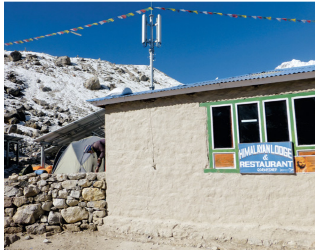
Mobilfunk-Mast in Gorak Shep unweit des Basislagers auf der Südseite des Mount Everest