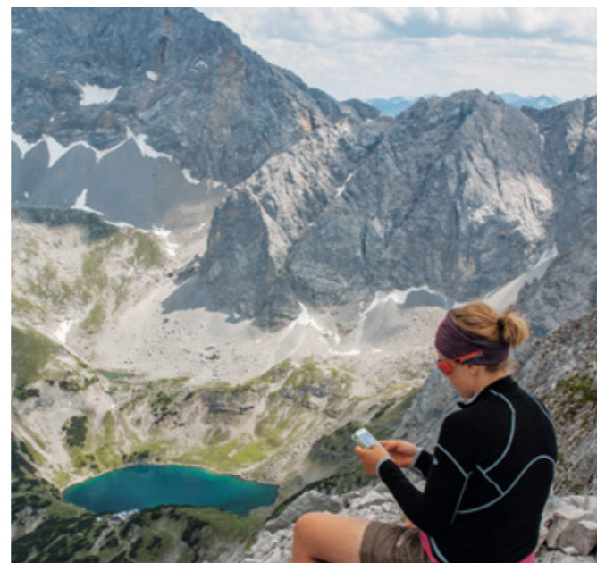
Gipfelkultur heute: SMS schreiben statt Ausblick genießen