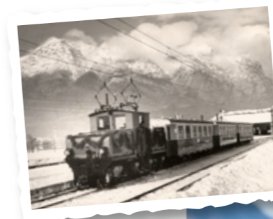
Links: Die Erfindung der Eisenbahn wirkte sich aufs Bergsteigen ähnlich gravierend aus wie heute die Digitalisierung

Ähnlich verhält es sich mit der Digitalisierung: Die Datenautobahnen haben den realen Raum nahezu vollständig „getötet“ und führen dadurch zu einer fast schwindelerregenden Beschleunigung der Kommunikation. Wer glaubt, man könne dadurch Zeit gewinnen, irrt, denn sowohl das Tempo der Handlungen als auch die Zahl derselben erhöht sich dadurch: Wurde früher ein Brief pro Woche verfasst, so sind es heute zehn Mails pro Tag. Die Digitalisierung trägt somit zur allgemeinen Steigerung des Lebenstempos bei, und diese überträgt sich notgedrungen auf den Bergraum: Früher saß man am Gipfel und aß seine Jause; heute sucht man schöne „Selfie“-Plätze, schießt Fotos mit der Digi-Kamera, um diese in Blogs oder Foren stellen zu können, verschickt mit dem Handy SMS, WhatsApp-Nachrichten oder Mails, teilt mit, wo man ▶