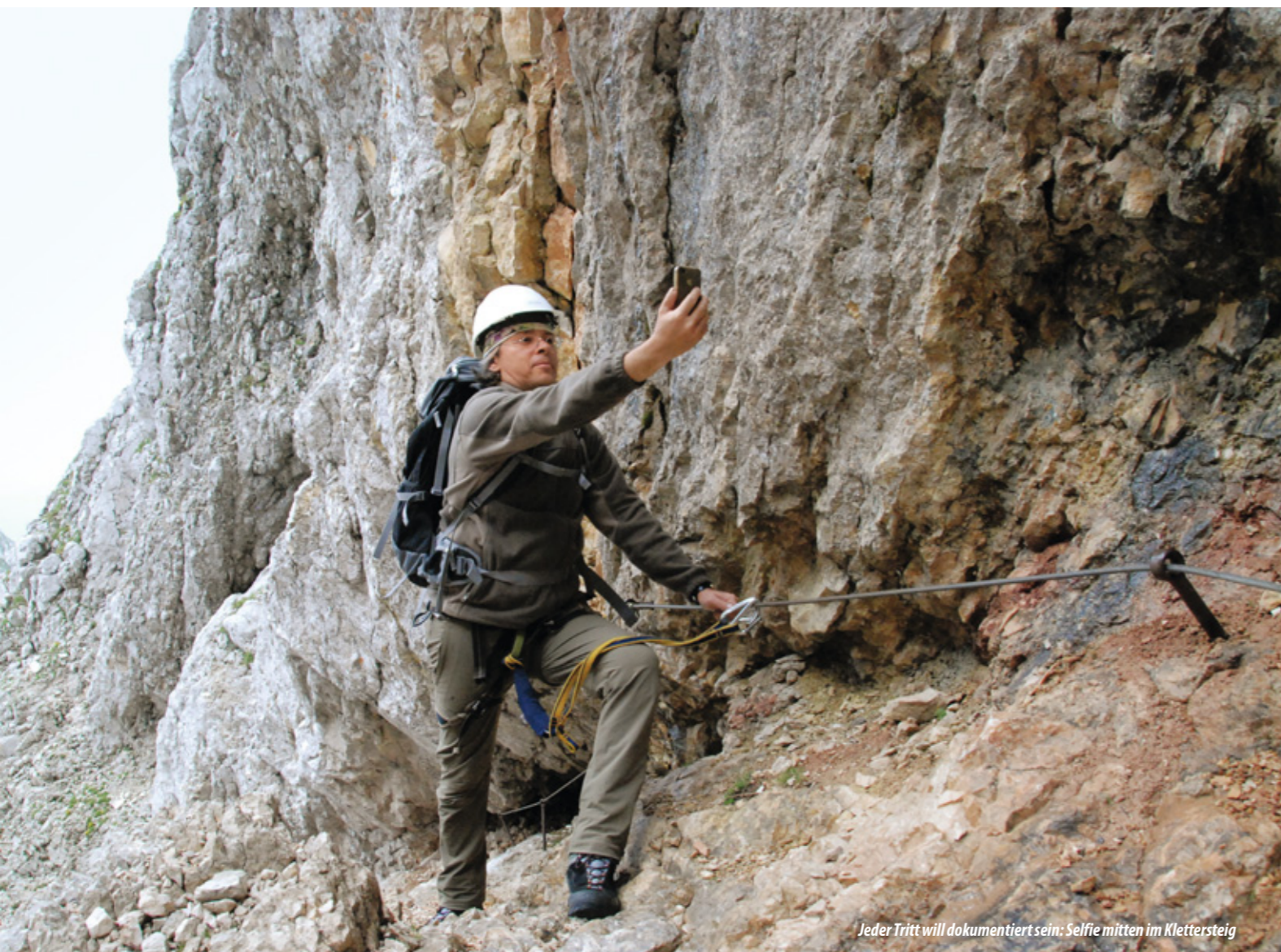
Jeder Tritt will dokumentiert sein: Selfie mitten im Klettersteig

Technische Modernisierungsprozesse machen auch vor den Bergen nicht halt: Im 19. Jahrhundert war es die Eisenbahn, heute ist es die Digitalisierung, die den Zugang zum Bergraum erleichtert, insbesondere das Erleben vor Ort aber auch tiefgreifend verändert.