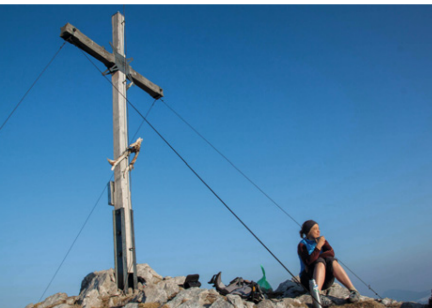
Selten geworden: Gipfeleindrücke einfach „nur“ genießen – ganz ohne Fotografieren, Nachrichten schreiben oder Telefonieren