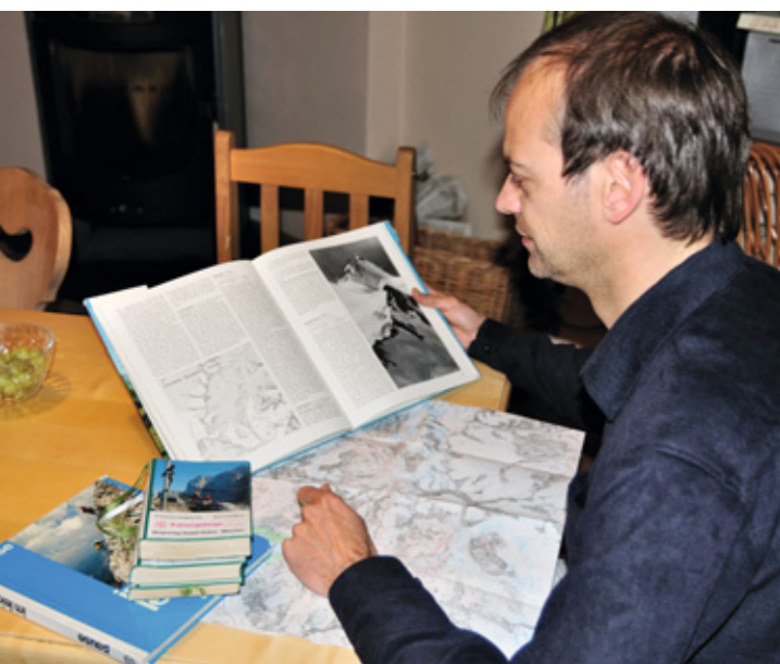
So plante man früher seine Touren: mit Buch, Führer und Karte

Wer dann am Ausgangspunkt loswandert, hat in der digitalen Welt des Bergwanderns die Wahl: Sofern nicht einfach Wegweiser reichen, kann man sich vom GPS-Gerät oder von einem GPS-tauglichen Smartphone führen lassen. Für Letzteres gibt es mittlerweile verschiedene Apps, die einen mittels Pfeil und Kartenhintergrund ähnlich wie ein klassisches GPS-Handgerät leiten. Dazu zählt die App von alpenvereinaktiv.com , die viele weitere Funktionen für den Outdoor-Einsatz bereithält. Vergleicht man Smartphones mit GPS-Geräten, sind Letztere allerdings meist robuster, haben ein effektiveres Display und bessere Energieversorgung. Beide Geräte nutzen die Satellitensignale aus dem sogenannten Global Positioning System (kurz: GPS), ein ursprünglich militärisch motiviertes Raumfahrtprogramm der USA, dessen Entwicklung bereits 1973 begann. Im Jahr 2000 wurde GPS für zivile Zwecke geöffnet, was zu einem enormen Boom zunächst bei Navigationsgeräten im Auto führte. Heute ►