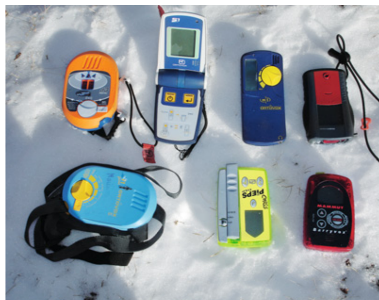
Die digitale Welt ist schnelllebig: LVS-Geräte im Jahr 2006