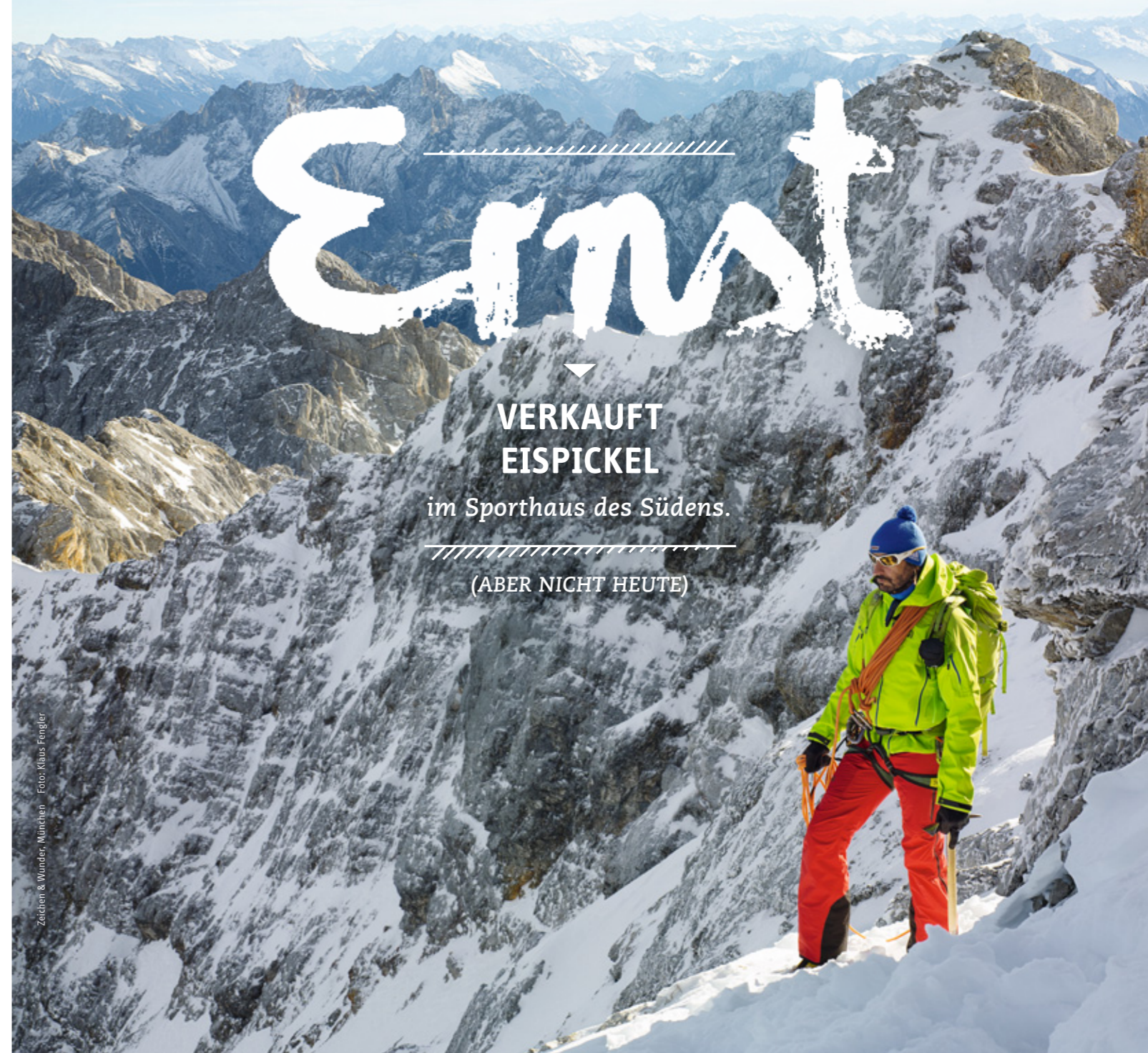
Zeichen &amp; Wunder, München