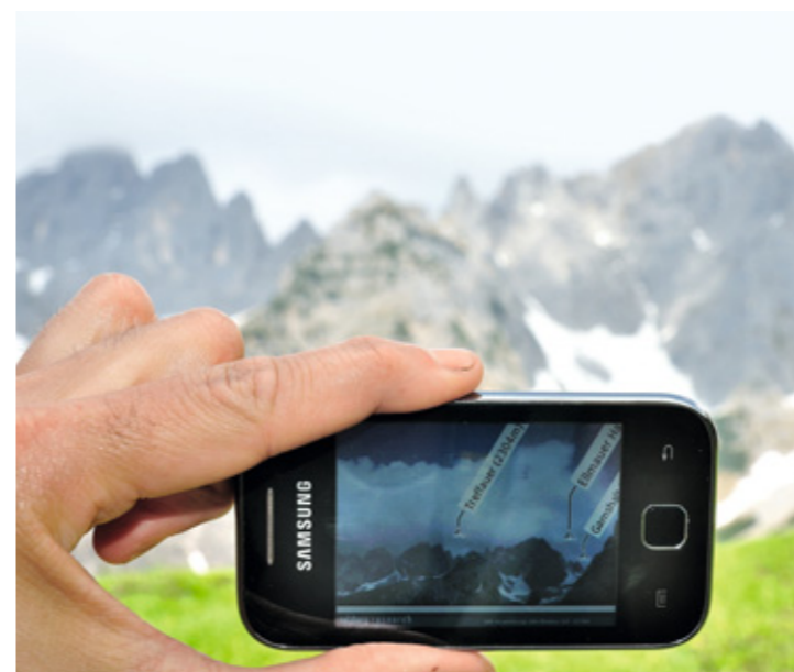
Gipfelbestimmung mittels App und Augmented Reality