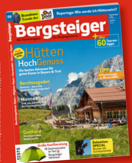
Brockmann Verlag GmbH, Infantenstraße 11a, 80797 München

NEUE SERIE: Über „Wilde Wege Bayerns“ auf einsame Gipfel und gemütliche Hütten!