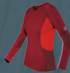
Longsleeve All-Year Women