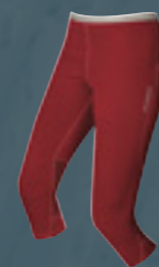
Pants 3/4 All-Year Women

Auf der Traverse. Tempo machen. Zweihundert athletische Skitourengeher liefen beim Beschleunigungstest am Julierpass bis ans Limit. Ihre Erfahrung: Mit der schnellen, leichten, kompakten und sicheren Pure Ascent-Ausrüstung kommt auch du mit Leichtigkeit auf Hochtouren. Folge der roten Spur der Mammut Speed Alpinisten: www.mammut.ch