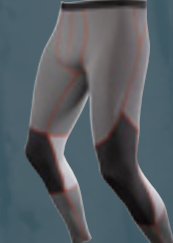
Pants long All-Year Men