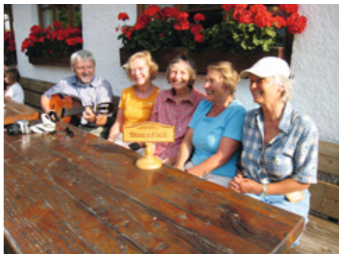
Der Berggliederstammtisch der Sektion München beim Singen