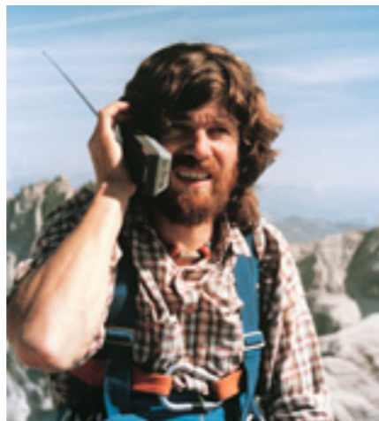
Reinhold Messner beim Gipfelfunkgespräch (1989)