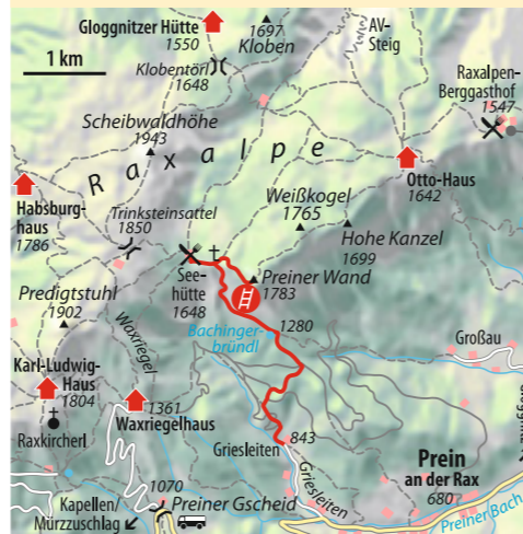
Text: Stephanie Geiger

ab München 5 Std. Bus & Bahn Bahn über Wien nach Payerbach-Reichenau, Bus 1748 nach Preiner Gscheid Talort Reichenau an der Rax, 484 m Schwierigkeit* Klettersteig schwer (C/D) Kondition mittel Ausrüstung kompl. Klettersteigausrüstung, Helm Dauer 6 Std. Höhendifferenz ↗ 900 Hm