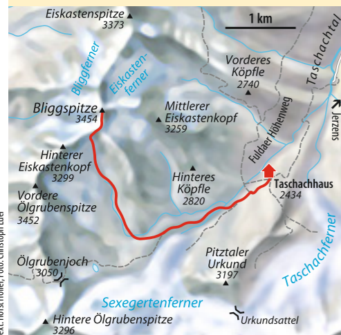
Text: Horst Hüller, Foto: Christoph Eder

ab München 3 Std. Bus & Bahn Bahn bis Imst/Pitztal, Bus bis Mandarfen/Mittelberg Talort Mandarfen, 1675 m Schwierigkeit* Hochtour mittelschwer Kondition mittel Anforderung Firn- und Felstour (Stellen I) Ausrüstung kompl. Hochtourenausrüstung Dauer > Hütte 2,5 Std., > > Gipfel 7 Std. Höhendifferenz > Hütte 770 Hm, > > Gipfel 1050 Hm