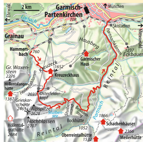
Text & Foto: Stephanie Geiger

ab München 1,5 Std. Bus & Bahn Bahn bis Garmisch-Partenkirchen, Zugspitzbahn bis Hammersbach Talort Hammersbach, 760 m Schwierigkeit* Bergtour Kondition groß Ausrüstung kompl. Bergwandausrüstung Dauer 9 Std. Höhendifferenz ↗ ↘ 1300 Hm