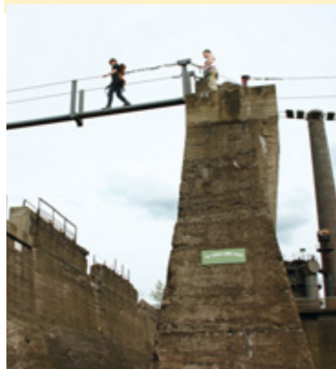
Text: Uli Aufdermann

ab München 6,5 Std. Bus & Bahn Bahn bis Duisburg, Straßenbahn 903 bis „Landschaftspark Nord“ Talort Duisburg, 33 m Schwierigkeit* Klettersteig schwer Kondition gering Anforderung große Anforderung an Armkraft, Technik und Psyche; für Anfänger nicht empfehlenswert Ausrüstung Klettersteigset, Kletterschuhe, Bandschlinge mit Karabinern zur Entlastung Dauer ca. 1 Std. Höhendifferenz > 25 Hm