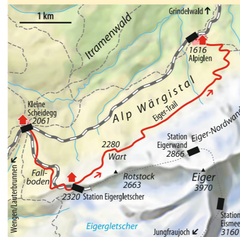
Text: Uli Auffermann

ab München 6 Std. Bus & Bahn Bahn über Interlaken nach Grindelwald, Wengernalpbahn bis Kleine Scheidegg Talorte Grindelwald, 1034 m Schwierigkeit* Bergwanderung leicht Kondition gering Ausrüstung kompl. Bergwandausrüstung Dauer: 3 Std. (8 km Strecke) Höhendifferenz > 260 Hm, < 700 Hm