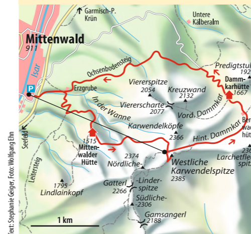
Text: Stephanie Geiger, Foto: Wolfgang Ehm

ab München 1,5–2 Std. Bus & Bahn Bahn über Garmisch-Partenkirchen nach Mittenwald Talorte Mittenwald, 912 m Schwierigkeit* Bergtour Kondition groß Ausrüstung kompl. Bergwandausrüstung Dauer 8–9 Std. Strecke ↗ ↘ 1450 Hm