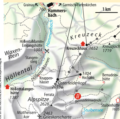
Text & Foto: Axel Jentsch-Rabl, www.alpinverlag.at

ab München 1,5 Std. Bus & Bahn Bahn bis Garmisch-Partenkirchen, Zahnradbahn bis Kreuzek-Alpspitzbahn Talort Garmisch-Partenkirchen, 708 m Schwierigkeit* Klettersteig sehr schwer (D/E) Kondition mittel Anforderung nur wenige gute Rastmöglichkeiten im Klettersteig Ausrüstung kompl. Klettersteigausrüstung, Helm, evtl. Sicherungsseil Dauer 4,5 Std. Höhendifferenz ↗ ↘ 500 Hm