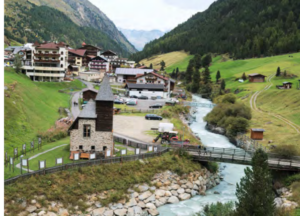
Vent: Auch hier gibt es inzwischen fünfstöckige Hotels, und die Steinbauten dominieren

„Wer heute so wirtschaftet, dass auch die nächste Generation mit dem Erreichten zufrieden ist und es weiter pflegt, liegt richtig.“