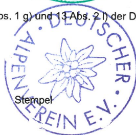
Datum Für das Präsidium des DAV